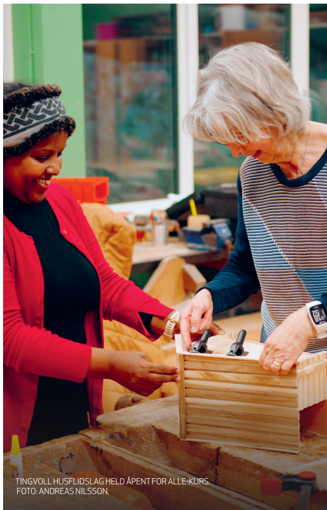
TINGVOLL HUSFLIDSLAG HELD ÅPENT FOR ALLE-KURS.