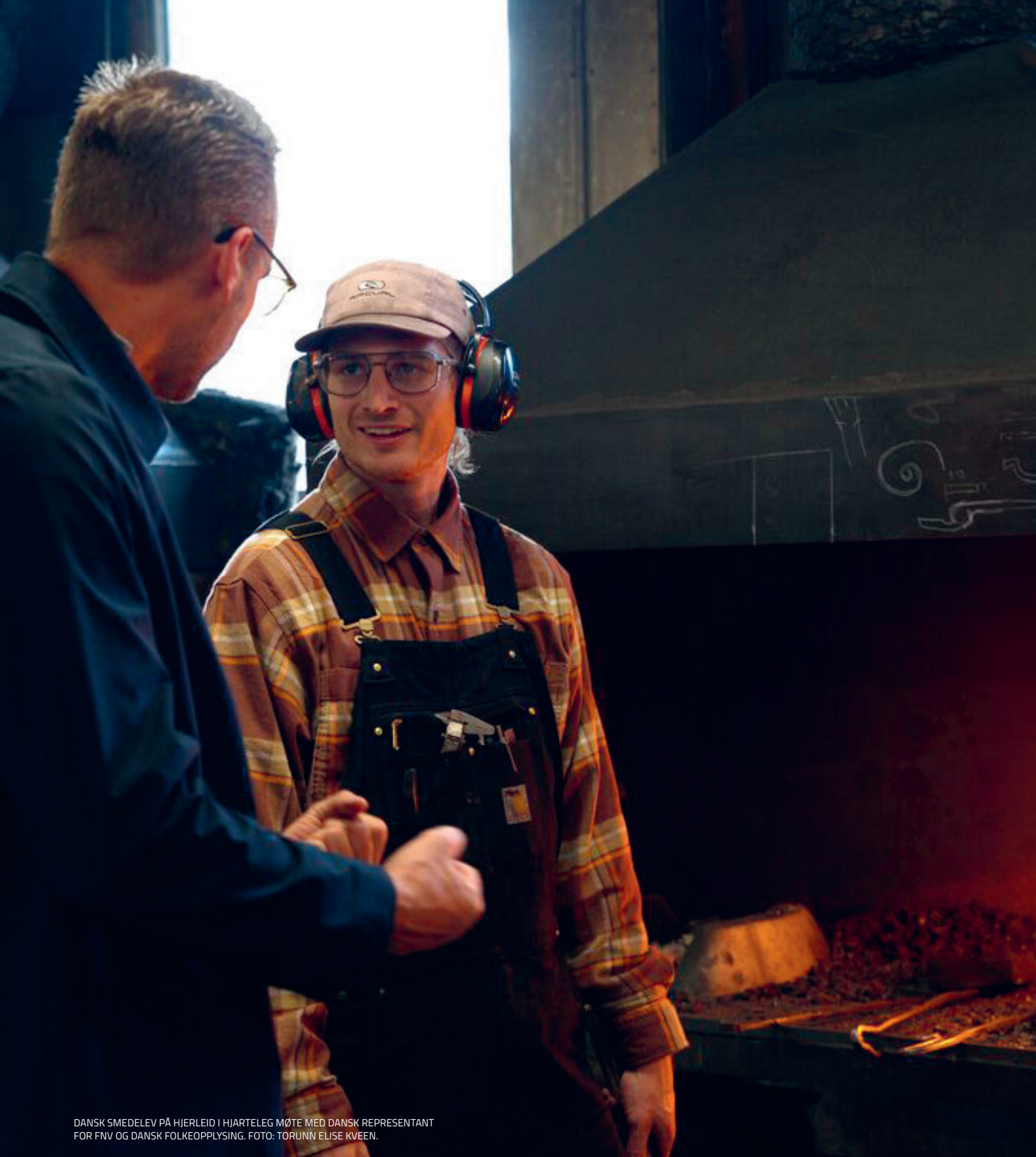
DANSK SMEDELEV PÅ HJERLEID I HJARTELEG MØTE MED DANSK REPRESENTANT FOR FNV OG DANSK FOLKEOPPLYSING.