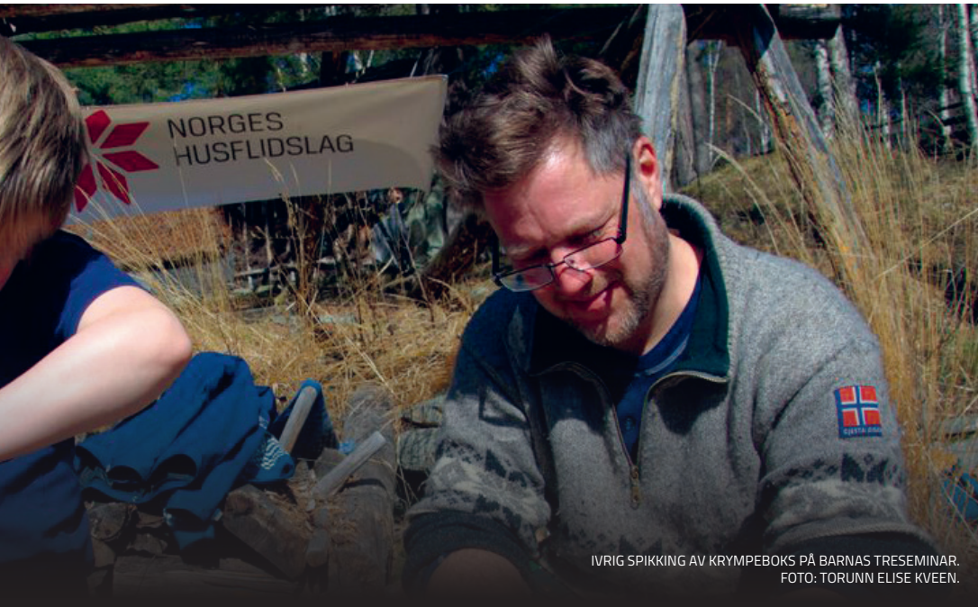
IVRIG SPIKKING AV KRYMPEBOKS PÅ BARNAS TRESEMINAR.