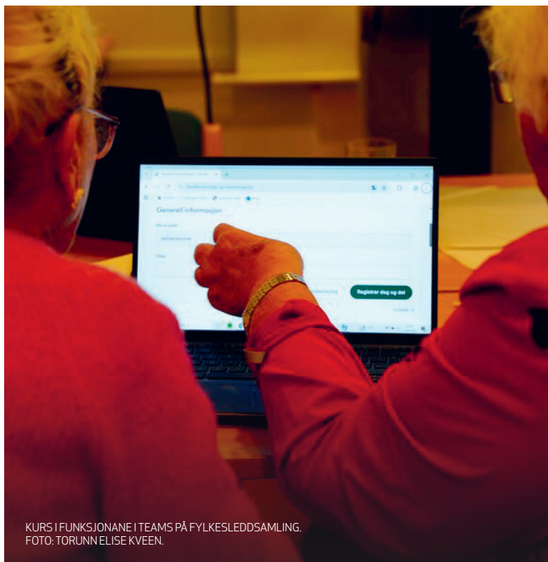
KURS I FUNKSJONANE I TEAMS PÅ FYLKESLEDDSAMLING.