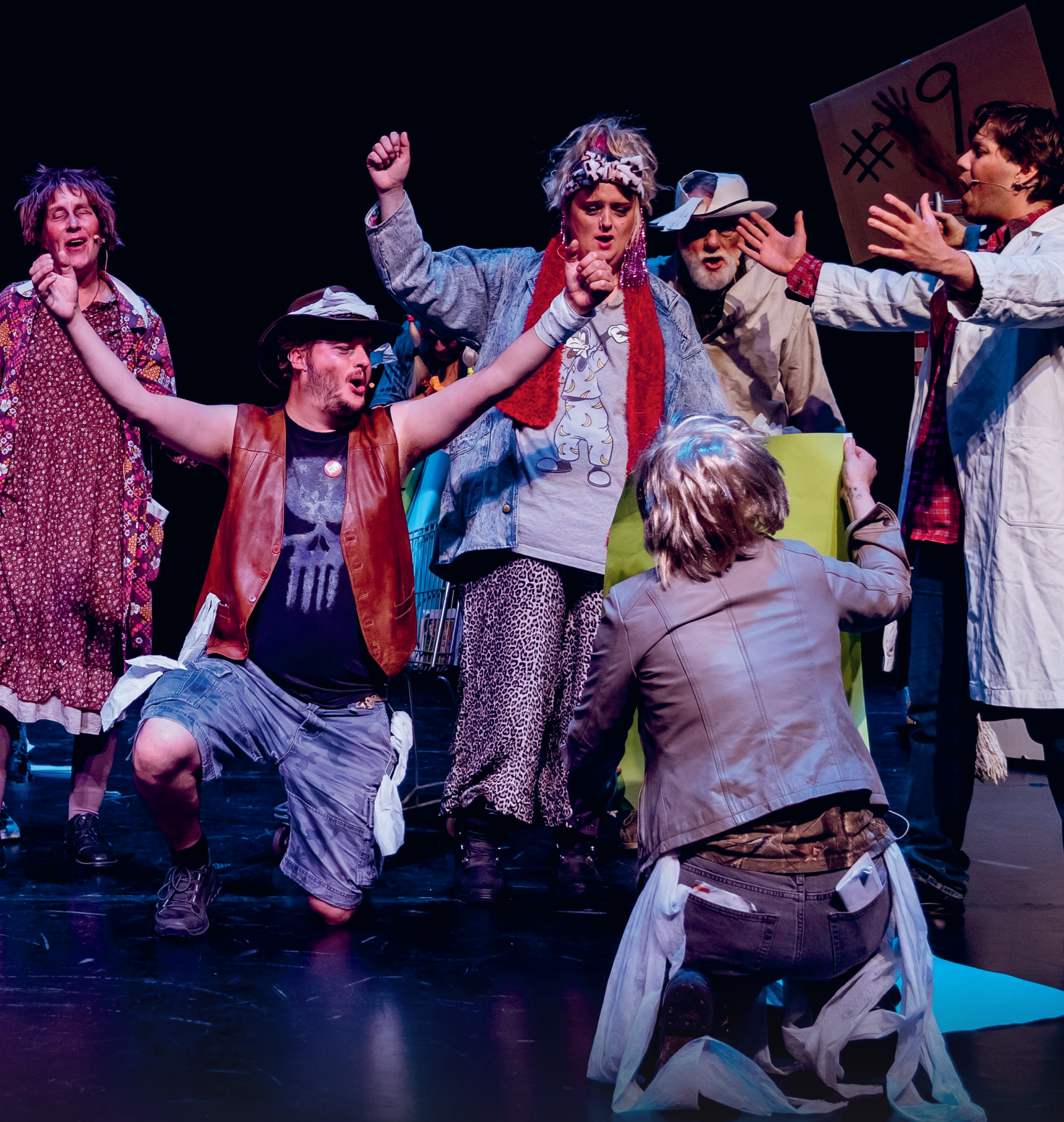
URINETOWN MED BYGDETRUPPEN TEATER.