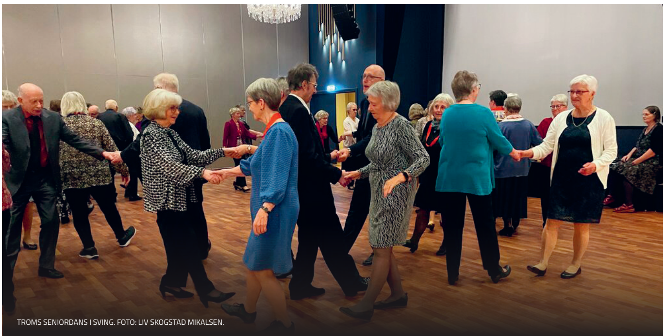
TROMS SENIORDANS I SVING.