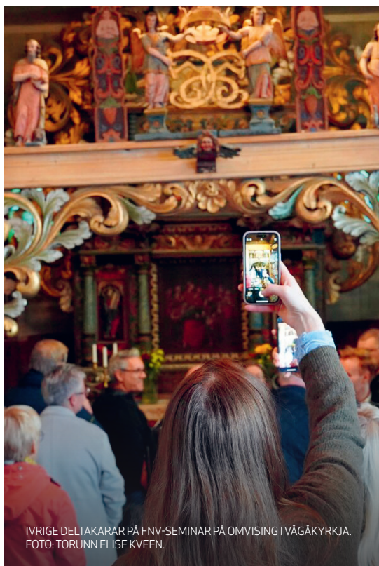
IVRIGE DELTAKARAR PÅ FNV-SEMINAR PÅ OMVISING I VÅGÅKYRKJA.

Deltakinga i FNV og det pedagogiske nettverket gjev oss auka kompetanse om organisering, pedagogikk og utvikling av kursverksemd. Denne kunnskapen kjem direkte til nytte i planlegging og gjennomføring av kurs som blir rapporterte til SSB, og bidreg til kvalitetsutvikling på tvers av fagområde.