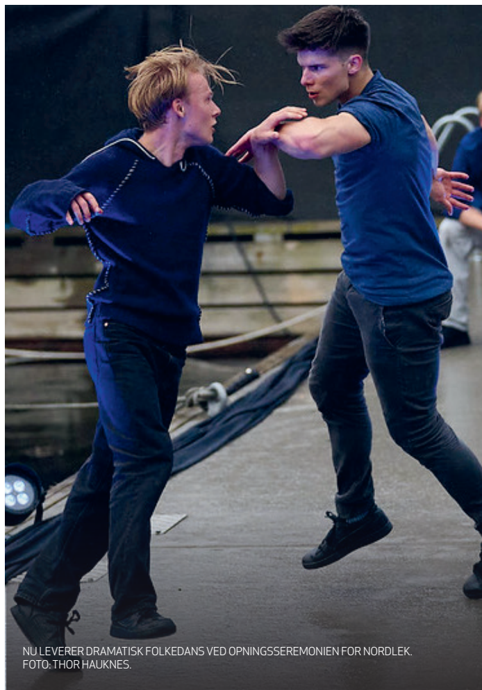
NU LEVERER DRAMATISK FOLKEDANS VED ÅPNINGSSEREMONIEN FOR NORDLEK.