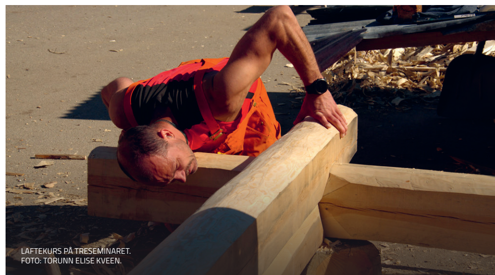
LAFTEKURS PÅ TRESEMINARET.

Garder oktober 2025. Vi fekk god påmelding på samlinga, men grunna ekstremvêr som ramma store delar av Noreg, vart fråfallet stort. Totalt ni deltakarar deltok på samlinga.