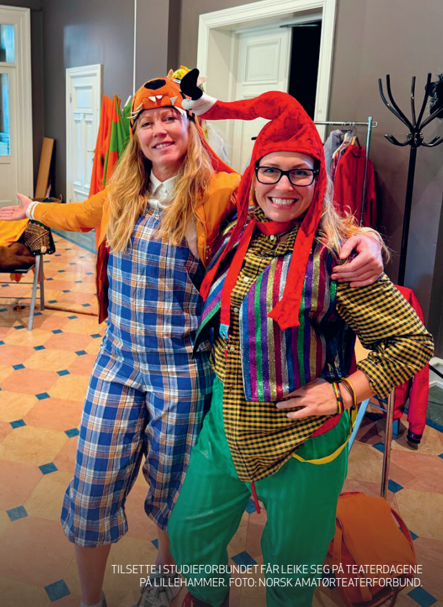
TILSETTE I STUDIEFORBUNDET FÅR LEIKE SEG PÅ TEATERDAGENE PÅ LILLEHAMMER.