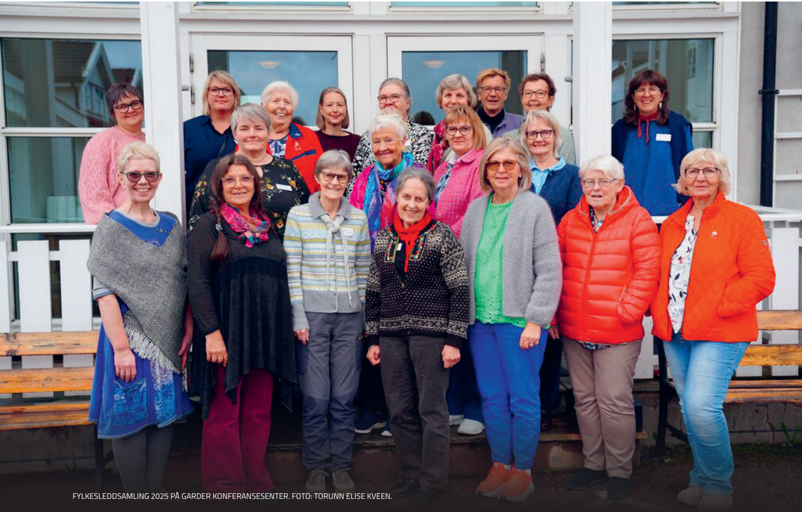
FYLKESLEDDSAMLING 2025 PÅ GARDER KONFERANSESENTER.