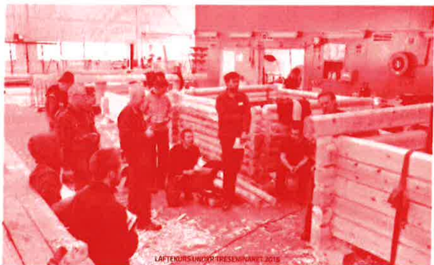
LÅFTENKURS UNDER TRESEMINARET 2016