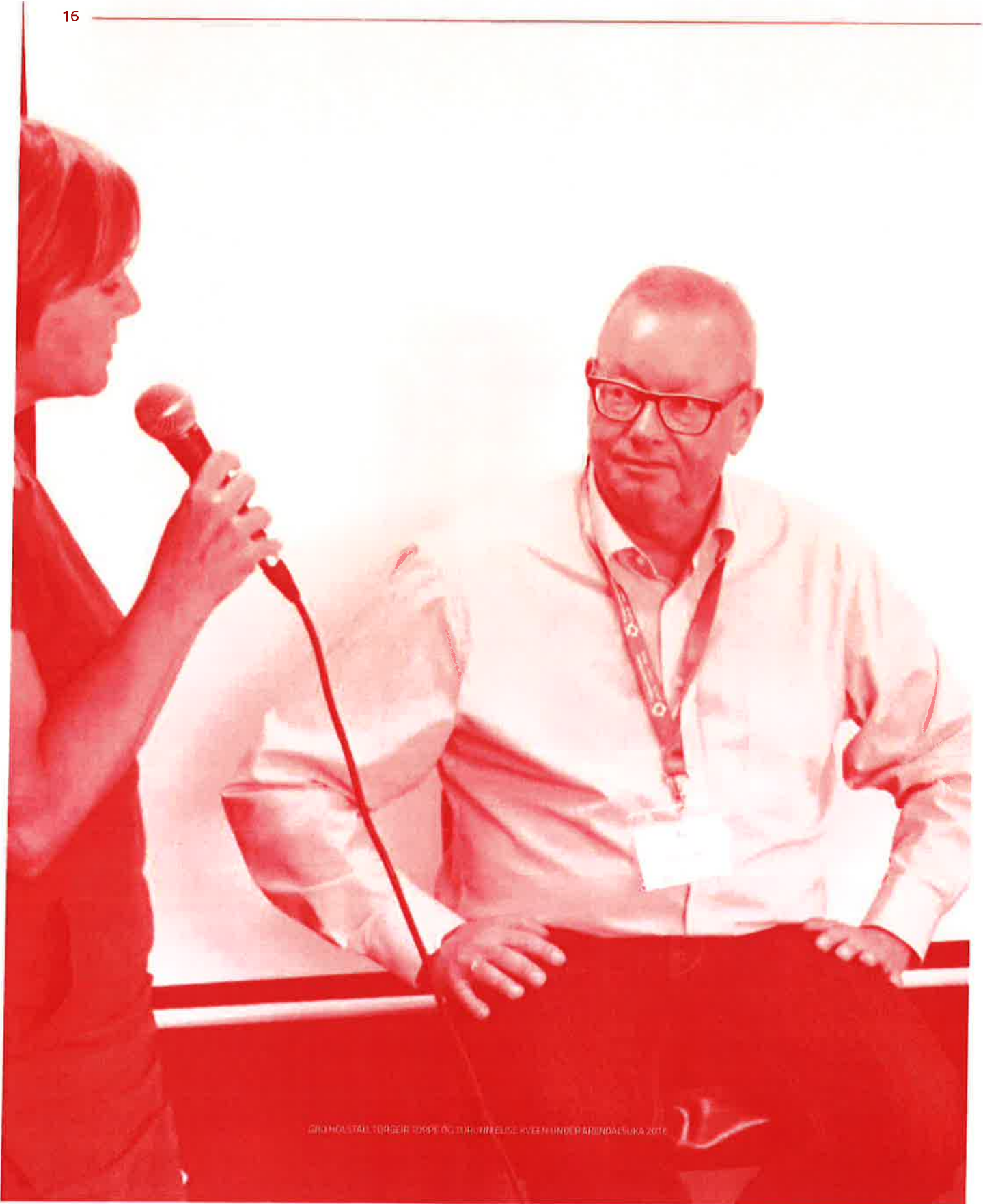
GRØNÅSTALL TORSDAG TORSDAG OG TIRSDAGS KVEEN UNDER ARRØNDAGSUKA 2016