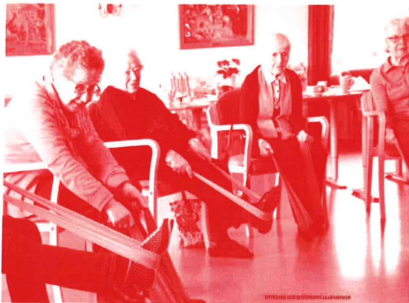
SITTEPANG HOS SENIORDANS LILLEHAMMER