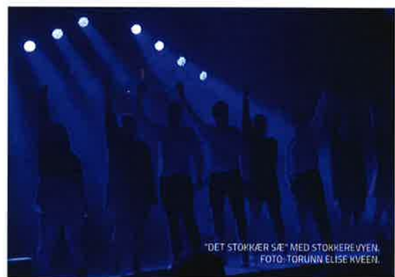
"DET STØKKER SÆ" MED STØKKEREVYEN