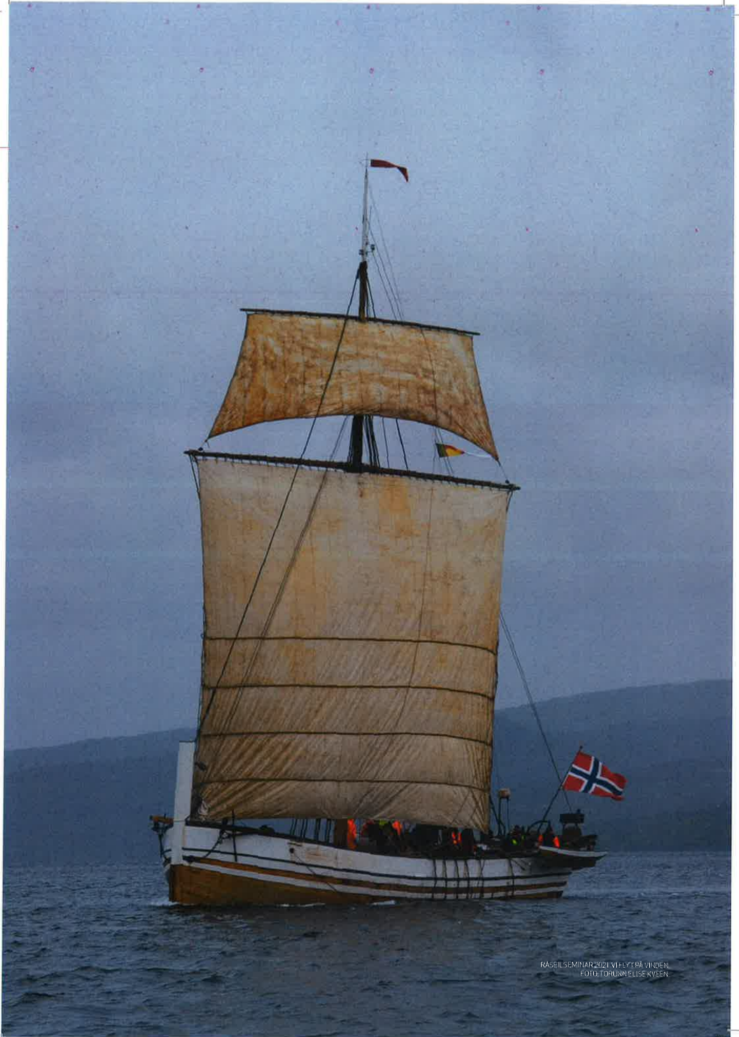
RACESEMINAR 2021 VI FLYT PÅ VERDEN