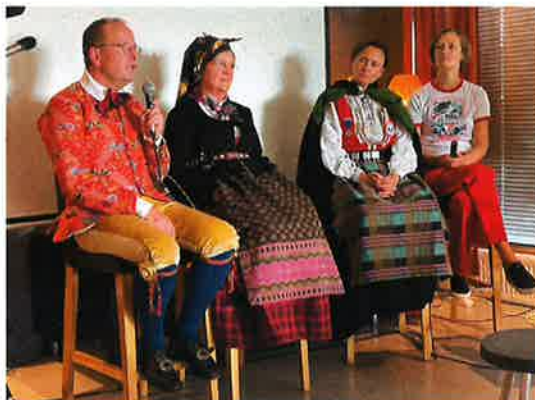
BUNADSEMINAR PÅ ARENDALSUKA 2021.