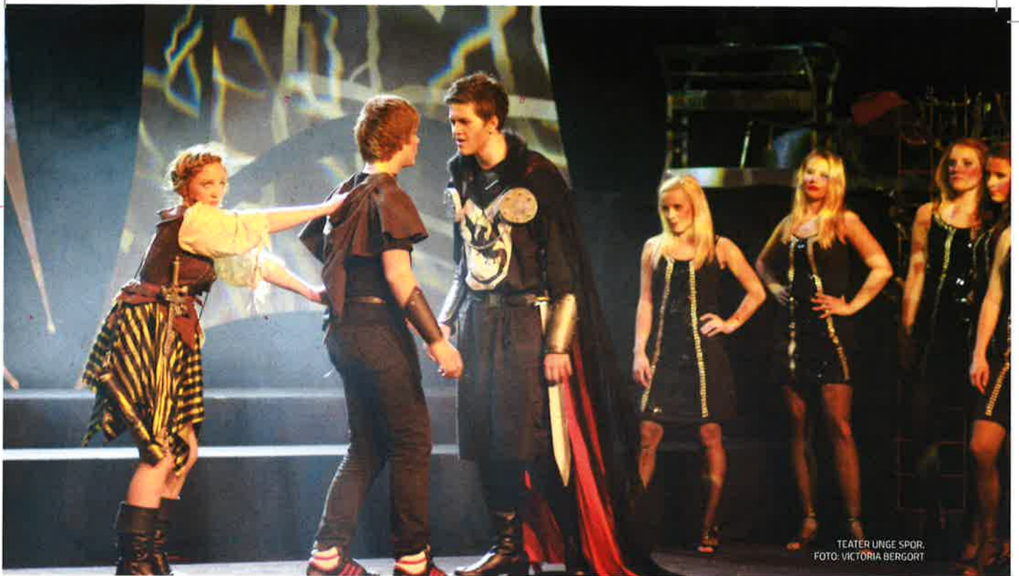
TEATER UNGE SPOR