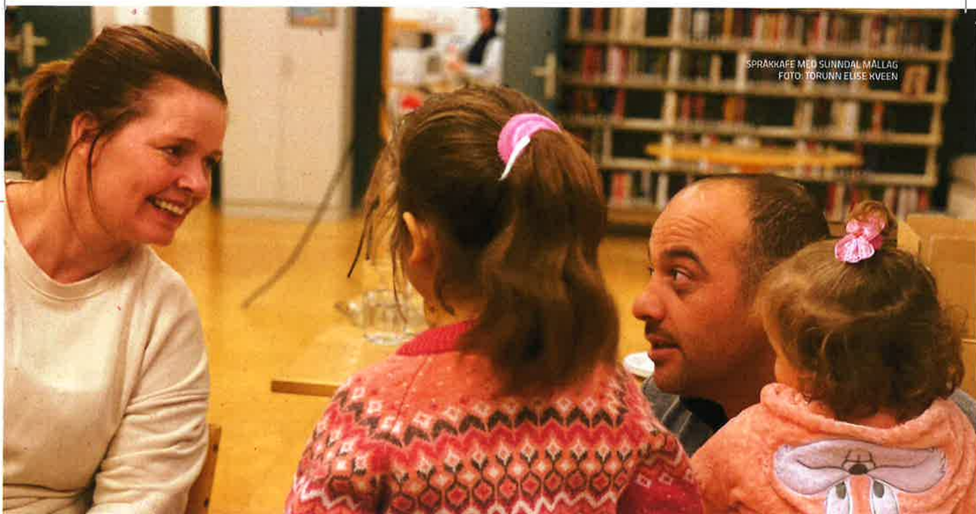
SPRÅKKAFE MED SUNNDAL MALLAG