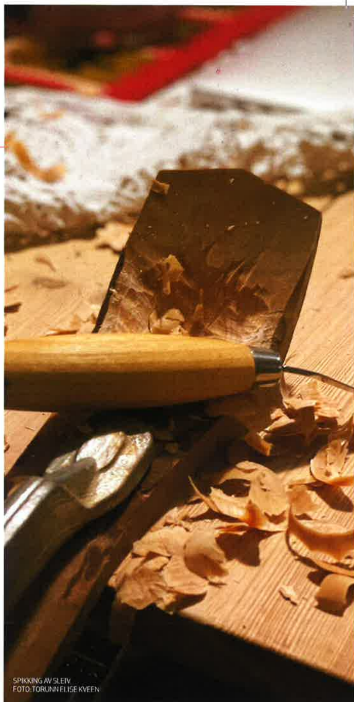
SPIKKING AV SLEIV