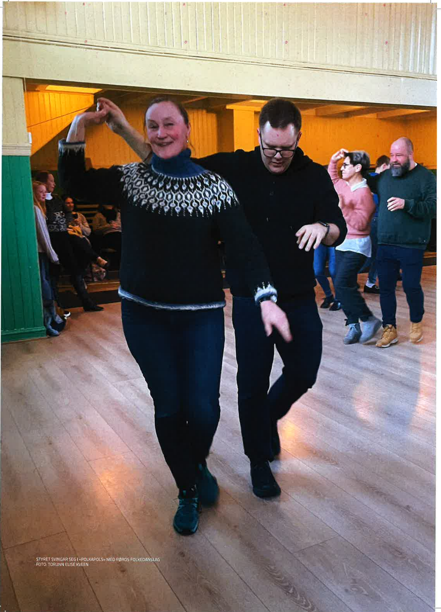
STYRET SVINGAR SEG I «POLKAPOLS» MED RØRDS FOLKEDANSLAG