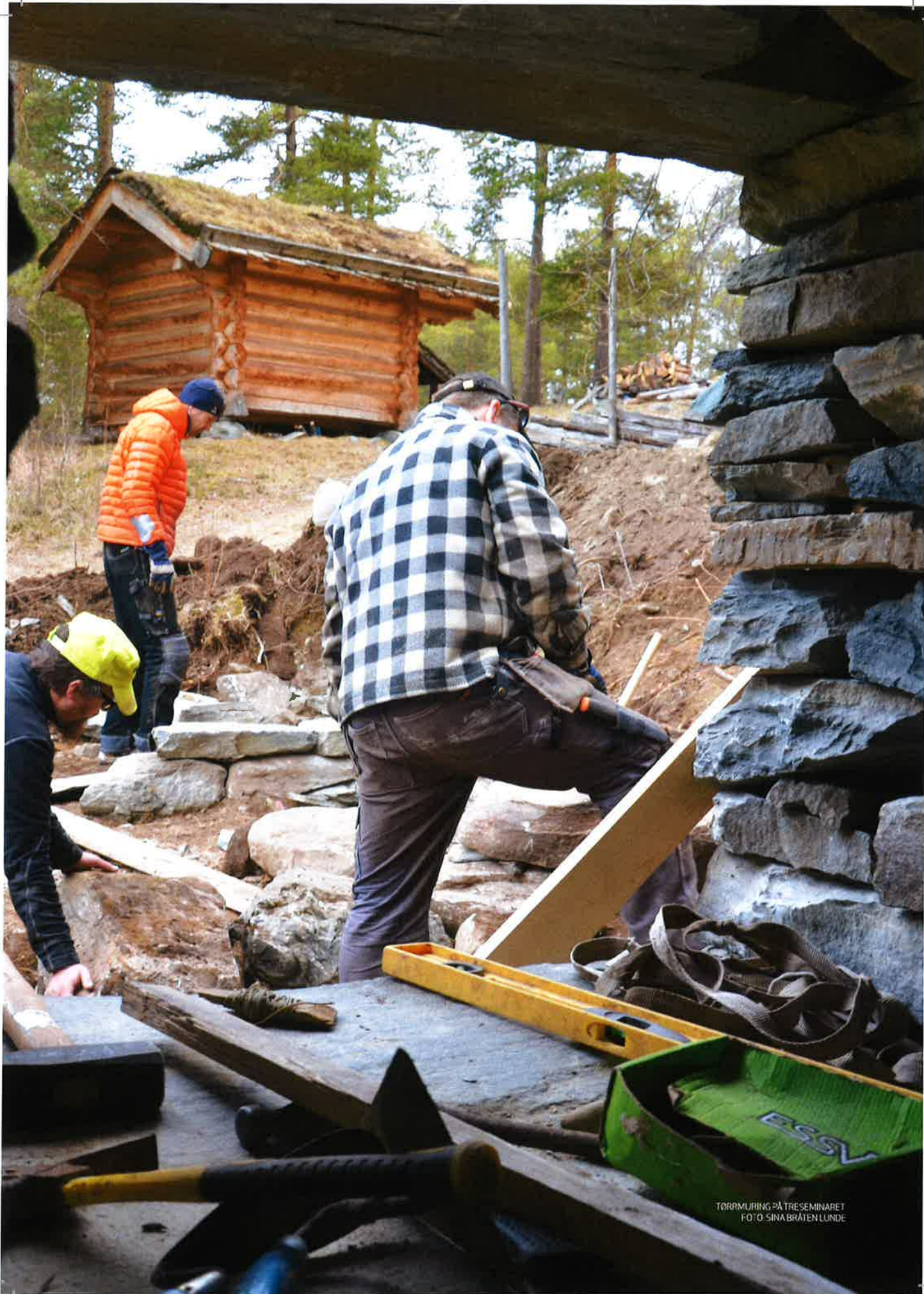
TÖRPMUHING PÅ TRESEMINARET