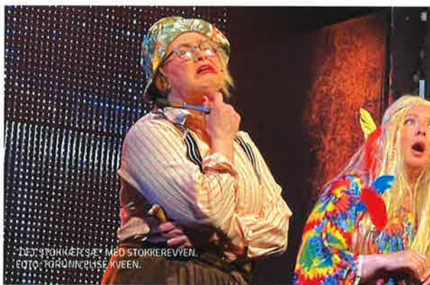
"DET STØKKER SÆ" MED STØKKEREVYEN, FOTO: TØRUNN ELISE KVEEN.