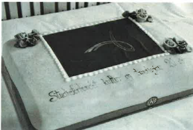
BILETE TIL HØGRE: KONKURRANSAR OG FEIRING I HØVE STUDIEFORBUNDETS 20-ÅRSJUBILEUM.