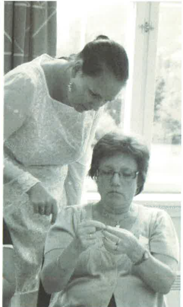
FRÅ BUNADOPPLÆRINGA.