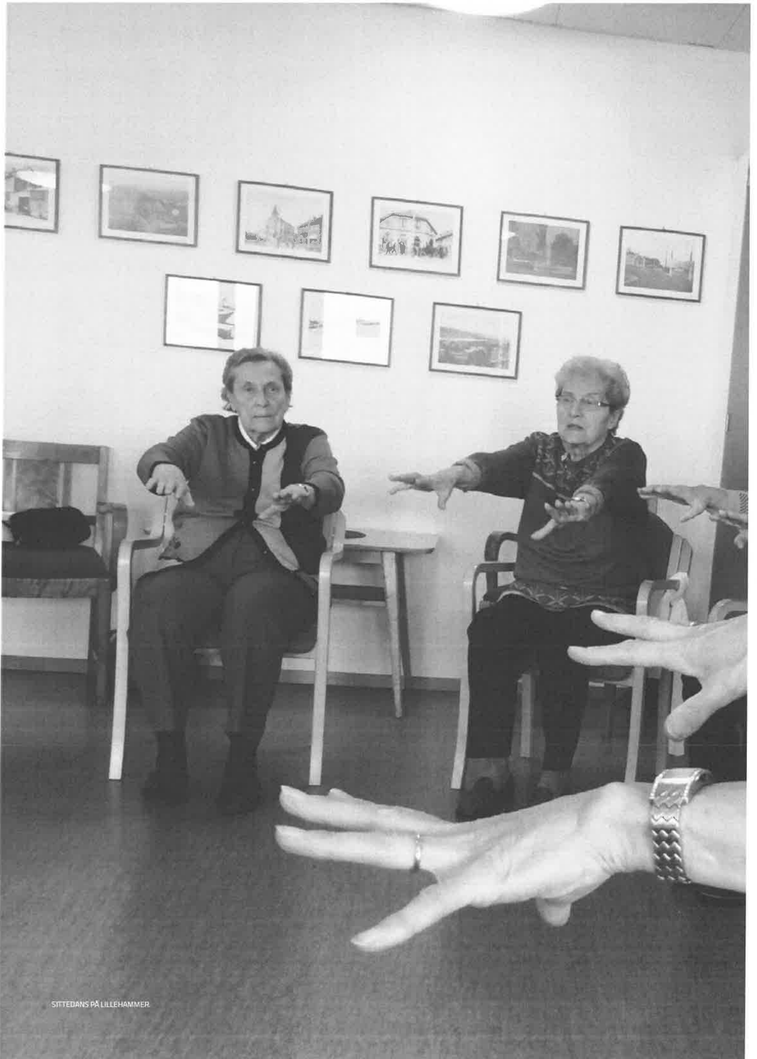
SITTEDANS PÅ LILLEHAMMER.