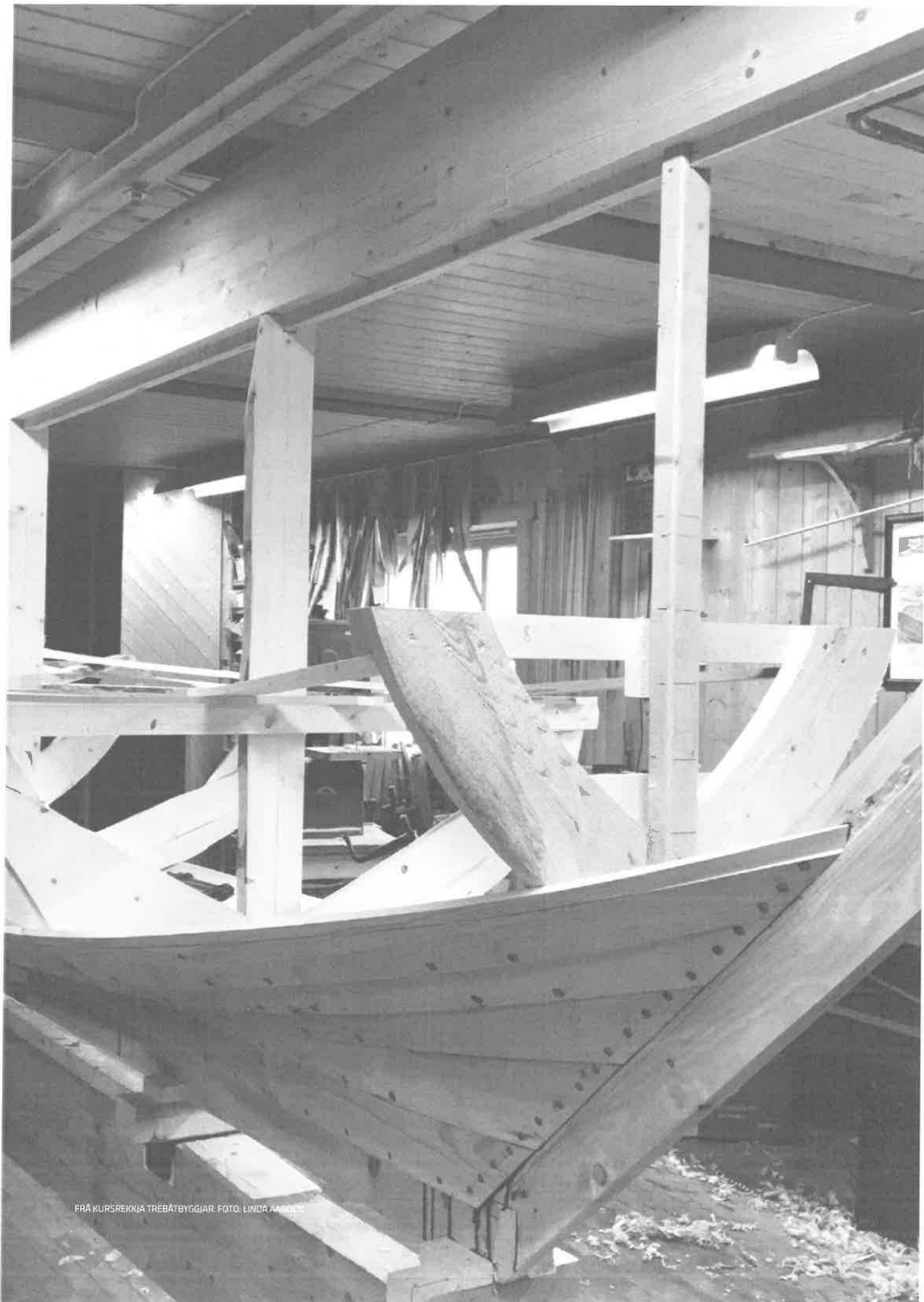
FRÁ KURSREKKJÁ TRÉBÁTBYGGJAR.