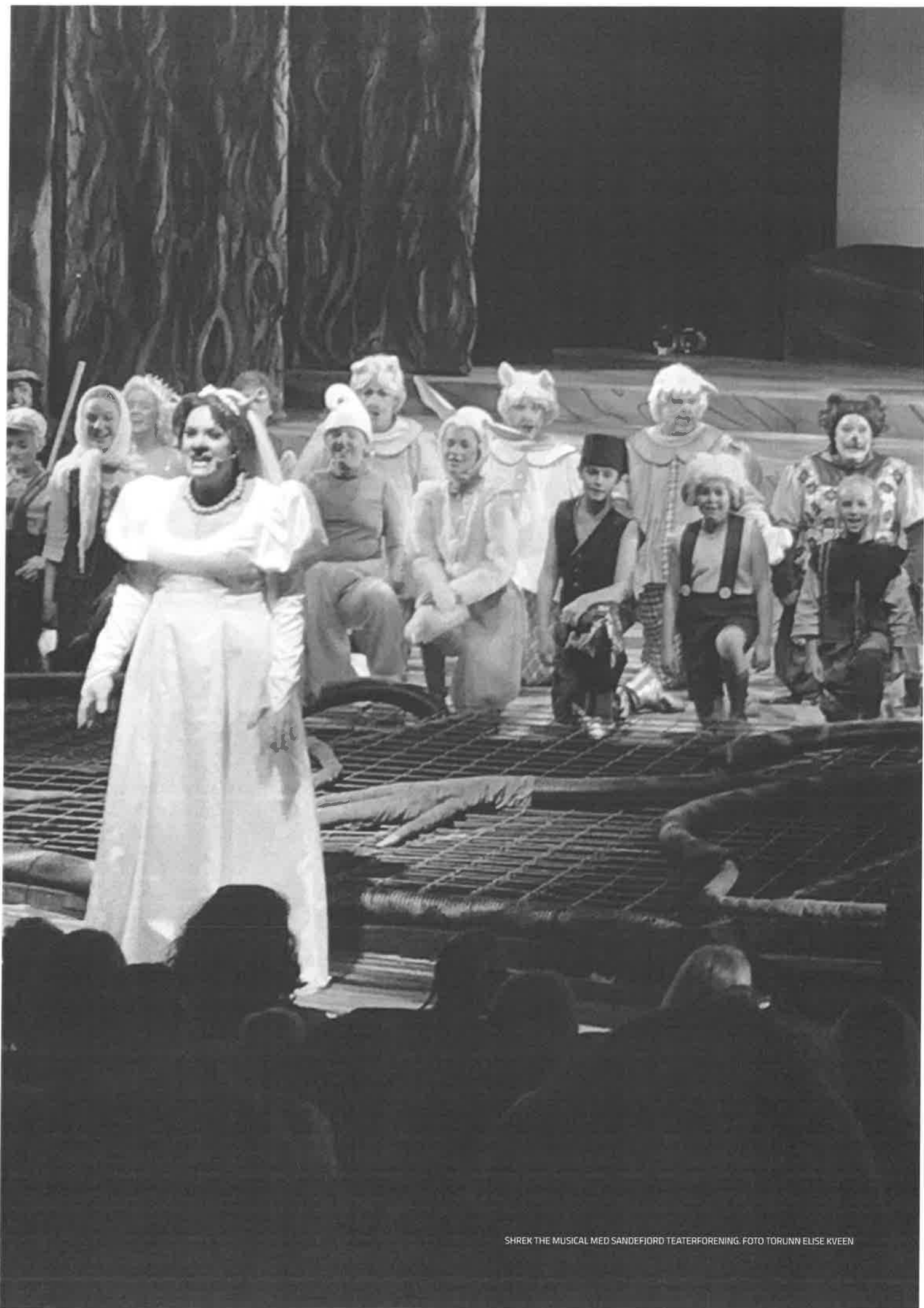
SHREK THE MUSICAL MED SANDEFIORD TEATERFORENING.