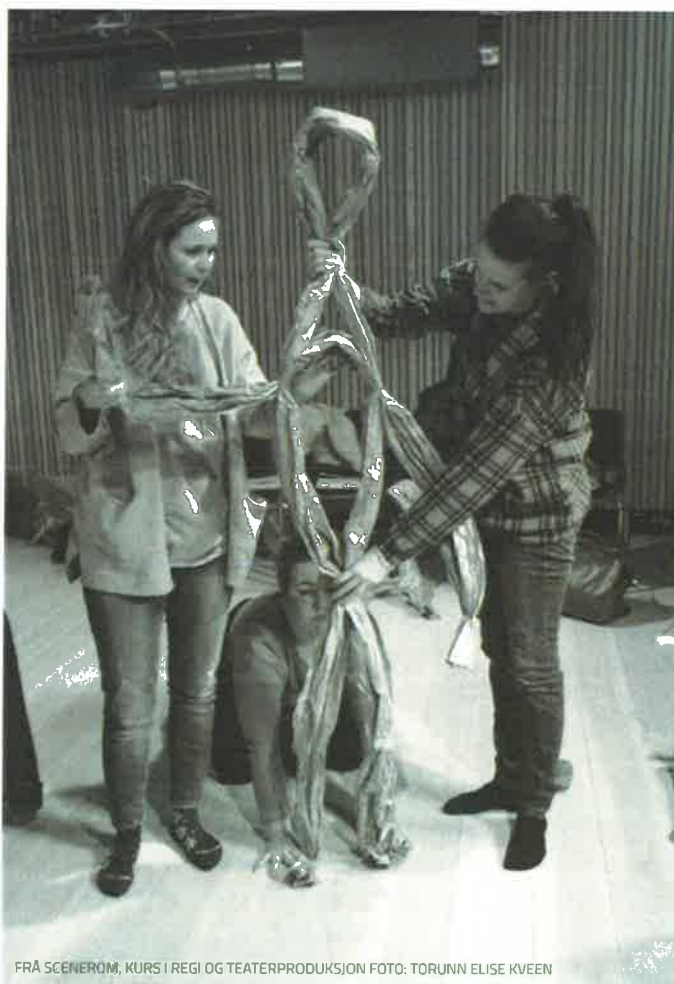
FRA SCENEROM, KURS I REGI OG TEATERPRODUKSJON

Studietilsynsforskrifta førte til at kurstilboda våre ikkje lenger vart godkjent. NOKUT vedtok i 2017 ny Kvalitetsforskrift som for så vidt opnar for å re-etablere samarbeid med UH-sektoren om tilbod. Det seier seg likevel i praksis å vere svært vanskeleg å få dette til. Studieforbundet har i 2017 hatt møter med fleire universitet og høgskular for å finne løysningar. Ved årsskiftet 2017/2018 er saka uvisst.