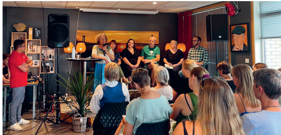
PANELDEBATT PÅ ARENDALSUKA: HVOR BÆREKRAFTIG ER BUNADEN, EGENTLIG?