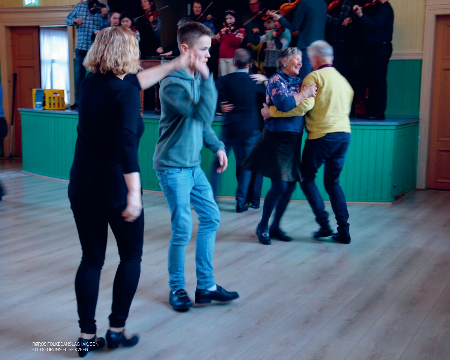
RØROS FOLKEDANSLAG I AKJSON. FOTO: TORUNN ELISE KVEEN