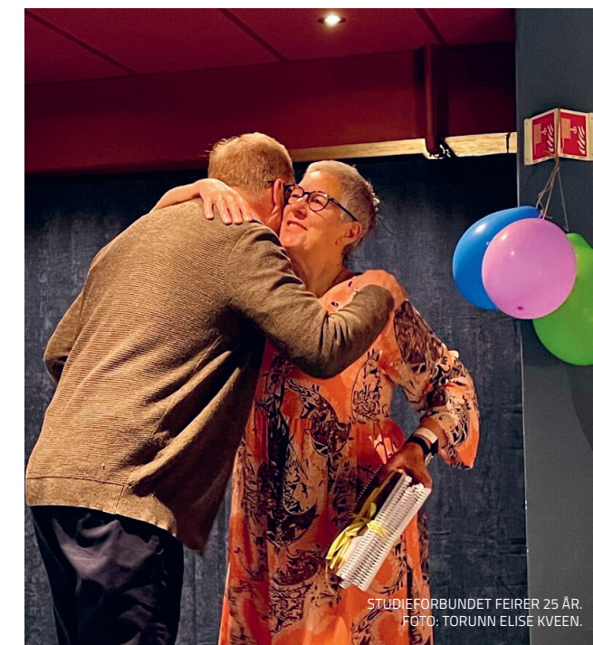
STUDIEFORBUNDET FEIRER 25 ÅR.

med fylkesledda, nokre få fysiske, dei aller fleste digitalt. Pandemien har gjort det nødvendig å tenkje alternative møteplassar, og har gjeve Studieforbundet forsterka moglegheit til å bidra gjennom digitale løysingar. Behovet for samhandling aukar med alle omstillingane vi til ei kvar tid står i.