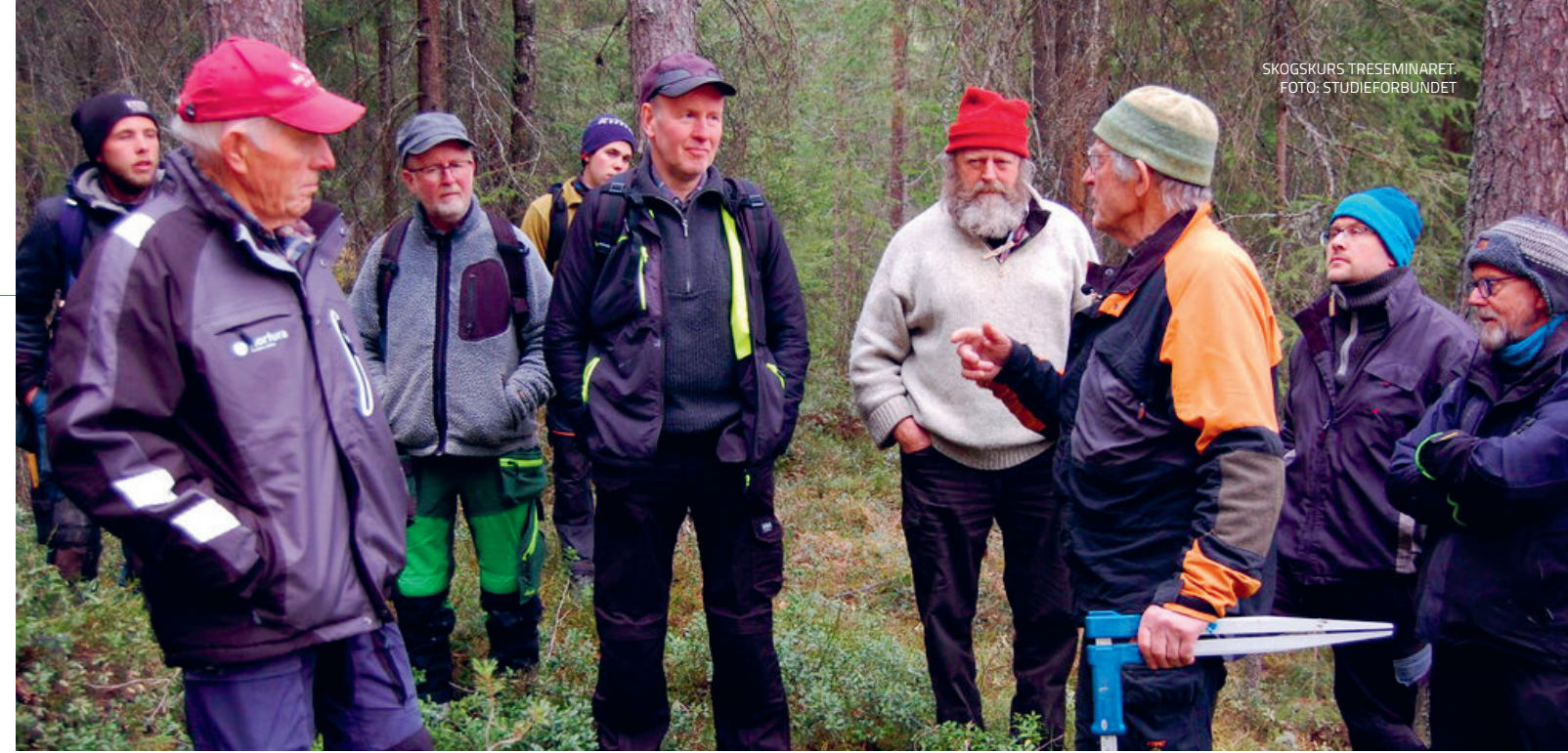
SKOGSKURS TRESEMINARET.

TILSKOT BLIR IKKJE UTBETALT UTAN AKSEPT FRÅ ORGANISASJONEN.