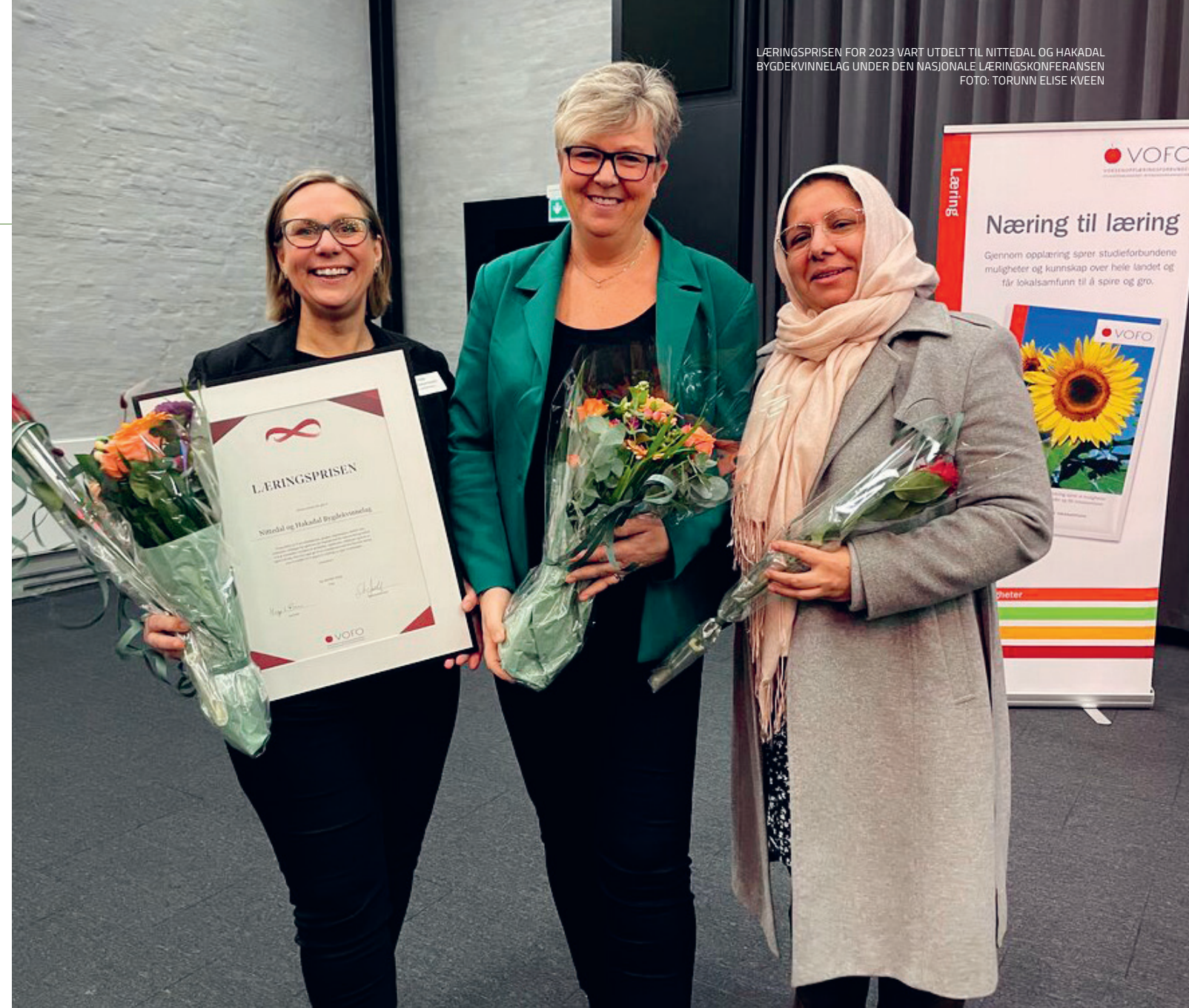
LÆRINGSPRISEN FOR 2023 VART UTDELT TIL NITTEDAL OG HAKADAL BYGDEKVINNELAG UNDER DEN NASJONALE LÆRINGSKONFERANSEN

Programmet var eit tilbod Studieforbundet ønskte å gje for å løfte både nåverande og framtidige leiarar innanfor organisasjonen.