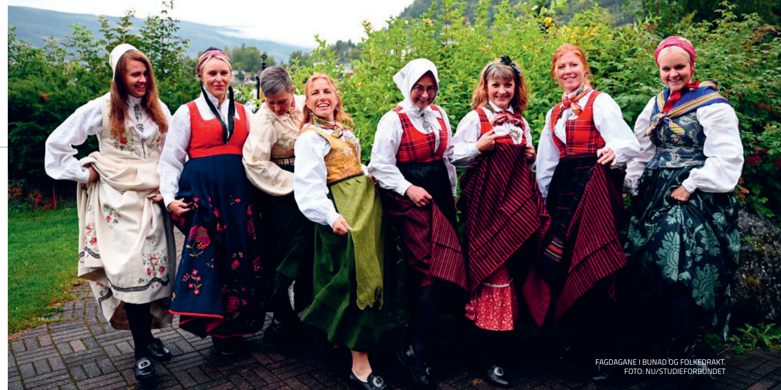
FAGDAGANE I BUNAD OG FOLKEDRAKT.